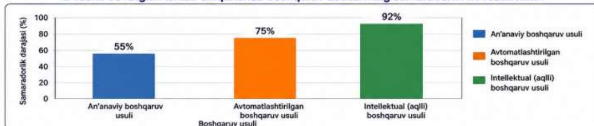
2-rasm. Sovutkich ishlab chiqarishda boshqaruv usullarining samaradorlik ko'rsatkichlari

NATIJARLAR: Natijalar shuni ko'rsatadiki, aqlli (intellektual) boshqaruv tizimlarini sovutkich ishlab chiqarish jarayonlarida qo'llash texnologik parametrlarni boshqarish samaradorligini sezilarli darajada oshiradi.