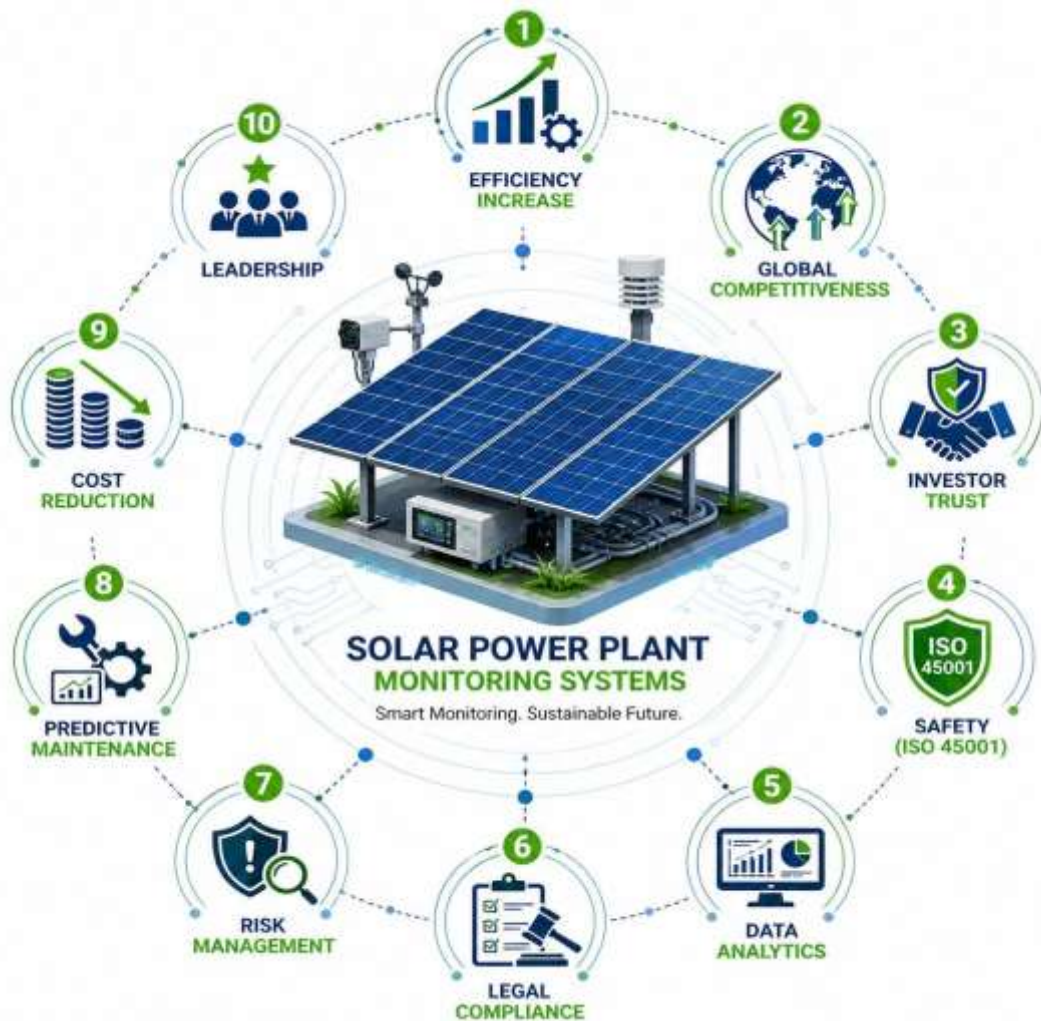
1-rasm. Monitoring va nazorat tizimlarining 10 ta asosiy afzalligi.

10. Xatarlar va imkoniyatlarni baholash: ISO 45001 va 50001 tamoyillari asosida nafaqat texnik xavflarni, balki energiya tejash imkoniyatlarini ham doimiy tahlil qiladi.